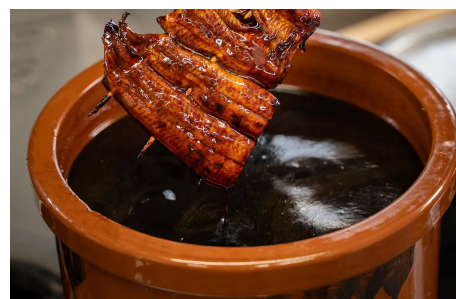
長年に渡り質のいい鰻を くぐらせてきたことで生まれた 凝縮された旨みのタレ