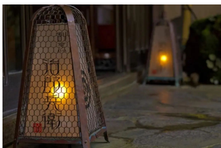
治郎兵衛初の ネット販売です！